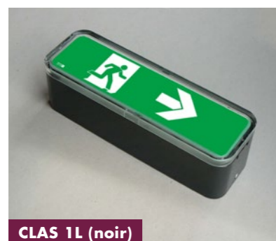
CLAS 1L (noir)