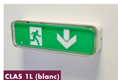
CLAS 1L (blanc)

La SÉRIE CLAS est équipée d'un boîtier très élégant par sa forme et son mode d'éclairage. La ceinture polycarbonate réagit comme un éclairage par la tranche qui entoure l'inscription sérigraphiée dans la masse de la plaque diffusante. Montage et démontage de cette dernière par encliquetage, particulièrement attractif pour l'exploitant qui en assure la maintenance. Le coffret réalisé, en aluminium, peut être traité dans les coloris des huisseries (alu naturel - doré bronze), coloris standard émail blanc.