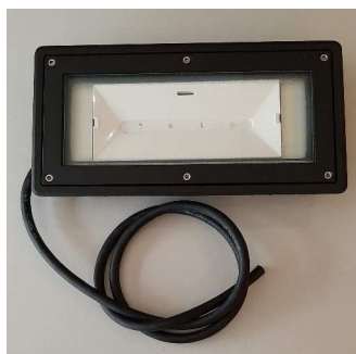
PRODUIT [Main characteristics of the product]