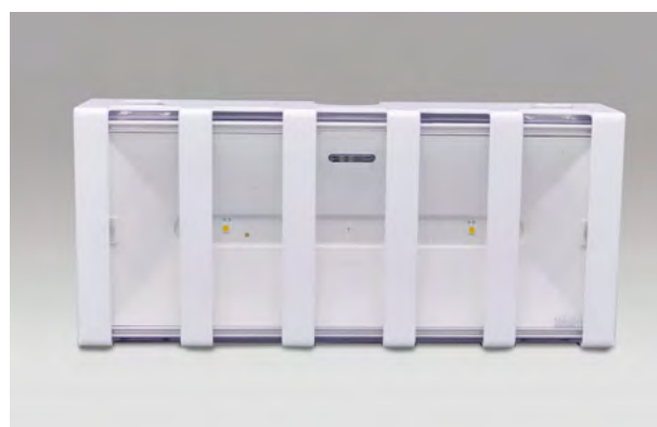
SAILLIE AVEC GRILLE