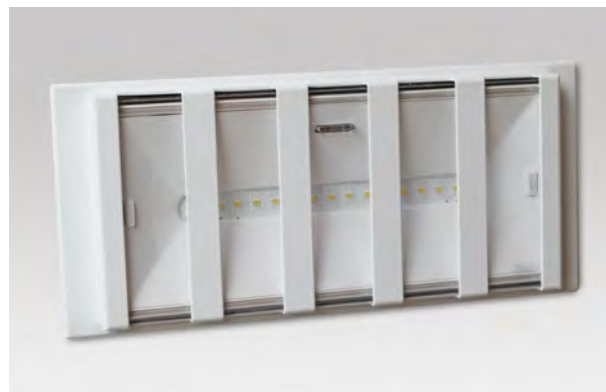
SEMI-ENCASTRÉ AVEC GRILLE