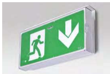
POSE PLAFOND EN DRAPEAU

PICTOGRAMMES (livrés avec chaque appareil - toutes directions possibles - conformes à la norme NF X 08-003 et CEE 77-576)