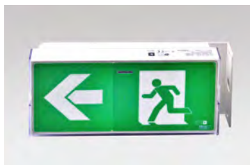
POSE EN ÉPI